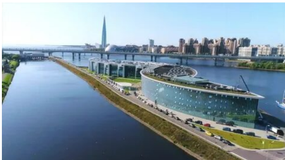
Санкт-Петербургский кадетский корпус «Пансион воспитанниц Министерства обороны Российской Федерации».

небольшую экскурсию по новым и кажущимся стерильно чистыми, не отягощенными пока еще историческими свидетельствами коридорам корпуса. Она рассказала о внимании, которое уделяет Пансиону руководство Министерства обороны и Председатель Совета Федерации Федерального собрания Российской Федерации Валентина Ивановна Матвиенко, показала пока еще немногочисленные подарки от почетных гостей Пансиона, которые, безусловно, в свое время составят основу музея этого уникального учебного заведения.